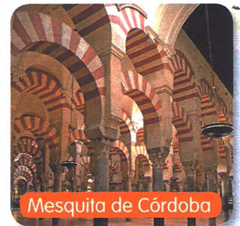
Mesquita de Córdoba

Construíram palácios, castelos, mesquitas e deixaram a técnica decorativa, como os mosaicos e os azulejos.