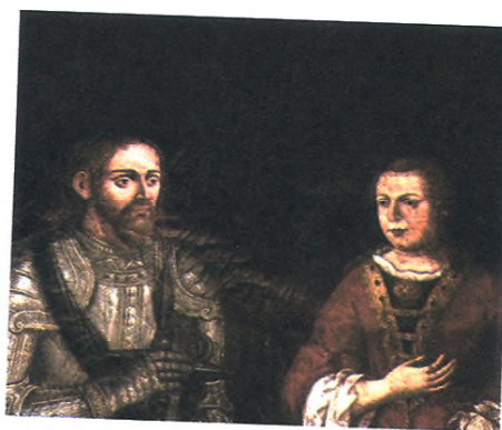
D. Henrique e D. Teresa

D. Henrique tinha de prestar obediência e auxílio militar a Afonso VI.